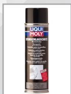
Steinschlagschutz überlackierbar, Spray, grau, Art.-Nr. 6105/500 ml