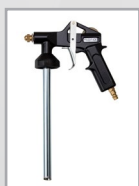
Spritzpistole, Art.-Nr. 6219