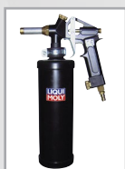
Druckbecher Pistole, Art.-Nr. 6220