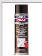
Steinschlagschutz überlackierbar, Spray, schwarz, Art.-Nr. 6109/500 ml