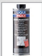
Steinschlagschutz überlackierbar, Spray, grau, Art.-Nr. 6106/1 l