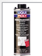
Steinschlagschutz überlackierbar, Spray, schwarz, Art.-Nr. 6110/1 l