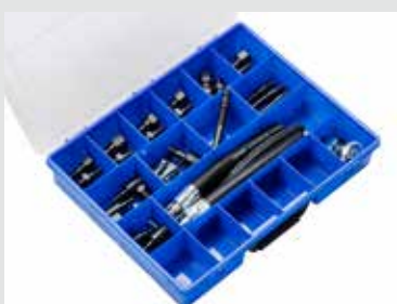
Adapter-Kit Standard 01 Art.-Nr. 29021

Umfangreicher Adaptersatz für die gängigsten Fahrzeuge.